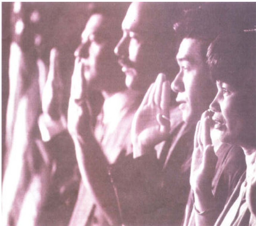
2003: US-Manager beschwören die Richtigkeit ihrer Bilanzen